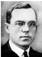
Bauernsohn Nikolai Kondratieff schaffte es in die russische Verwaltung und die Verfassungsgebende Versammlung. Nach der Oktoberrevolution fiel er in der Sowjetunion in Ungnade.

Heute vor 75 Jahren erschossen ihn die Kommunisten nach acht Jahren Haft. Denn seine Sicht der Wirtschaft ist in Stalins Reich unerwünscht: Die Weltwirtschaftskrise sei nicht der vorhergesagte Zusammenbruch des Kapitalismus, sagt Kondratieff, sondern nur ein tiefes Tal zwischen zwei langen Strukturzyklen. Schon 1928, vor dem großen Börsenkrach, hatte der Konjunkturforscher eine schwere Rezession vorhergesagt. Denn im Kohleverbrauch, in Preisen und in der Industrieproduktion westlicher Länder hatte er seit